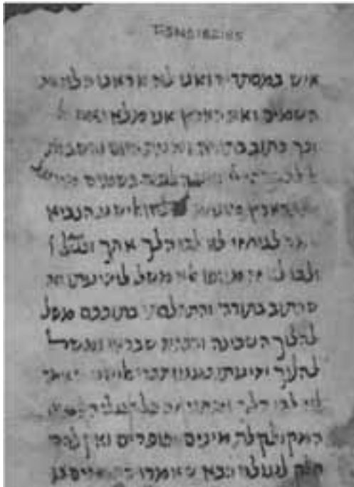
כת"י קמברידג', ספריית האוניברסיטה T-S NS 162.85

בסיום הדברים, לא נותר לנו אלא לקוות שיימצאו דפים נוספים מהחיבור המרכזי שנידון כאן, ואז, מלבד הדברים החדשים שיתגלו בהם, אולי נוכל גם להכריע באופן סופי את שאלת זהות החיבור, אחרי שביררנו בעזרת ה' את זהות מחברו.