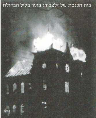
בית הכנסת של זלצבורג בוער בליל הבדולח

הממשל הנאצי חודשים מראש לשבוע השני של נובמבר 1938, והוא רק הוקדם בכמה ימים בגלל ההתנקשות בפריס. אמנם עד היום מעתיקים היסטוריונים רבים את השקר של שר התעמולה הנאצי גֶבְלֶס שאלו היו פרעות ספונטניות, כאילו הייתה זו האמת לאמיתה.